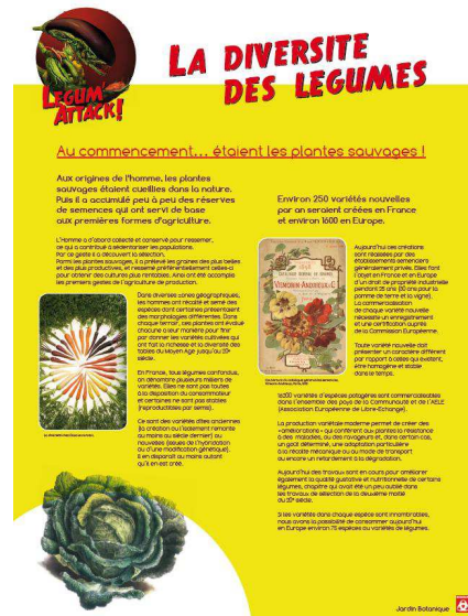
Exemple de panneau