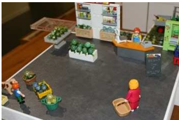
Exemple de maquette